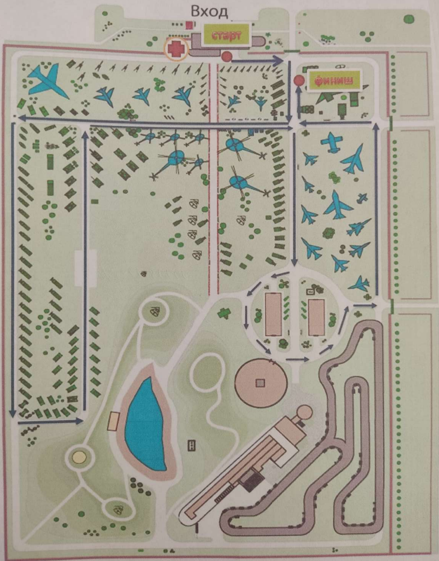
Схема движения спортсменов на соревнованиях 09.08.2024 (дистанция 2 км.)